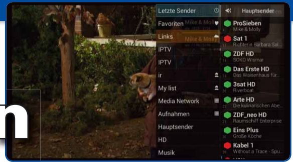
Die Kanalliste bei der Fernsehfee wird dynamisch generiert und richtet sich nach „Beliebtheit“ von Sendungen. Ein roter Punkt zeigt an, auf welchem Sender gerade Werbung ausgestrahlt wird

Während ARD und ZDF ihr Programm zum Großteil über die Haushaltsabgabe finanzieren, ist man beim Privatfernsehen auf das Schalten von Werbeplätzen angewiesen. Mehrere Stunden pro Tag wird das Programm bei RTL, Sat.1 und Co. von Werbeblöcken unterbrochen. Mit der „Fernsehfee“ gibt es jetzt einen praktischen Helfer, der Werbung automatisch erkennt und ausblendet. Wir haben es ausprobiert.